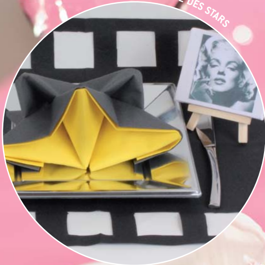
L'ÉTOILE DES STARS