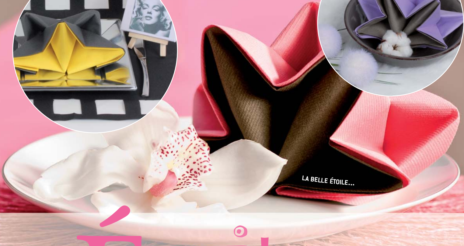
LA BELLE ÉTOILE...