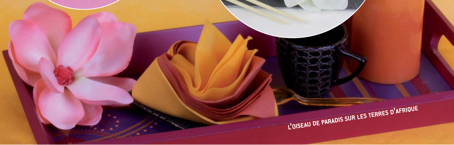
L'OISEAU DE PARADIS SUR LES TERRES D'AFRIQUE