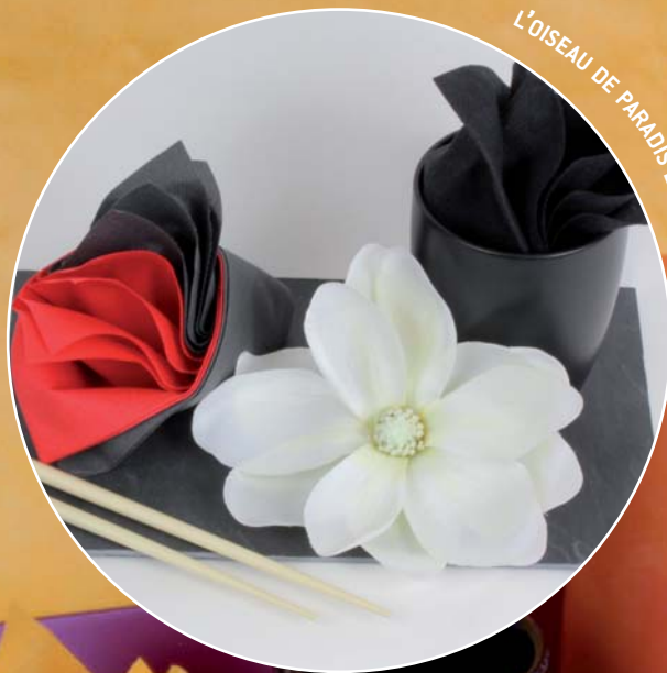
L'OISEAU DE PARADIS EN ASIE