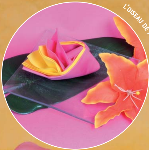
L'OISEAU DE PARADIS À HAWAÏ